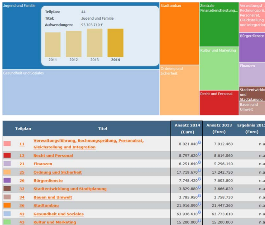
Abb. 1: Ausschnitt aus dem offenen Haushalt der Stadt Jena.

Beispiele aus der Praxis: Beim Bundesprojekt „Offener Haushalt“ 12 werden die Haushaltsdaten des Bundes grafisch dargestellt. Es handelt sich allerdings um keine klassische Open Data-Umsetzung, denn der Bund hat seine Haushaltsdaten weder in maschinenlesbarer Form noch unter einer freien Lizenz zur Verfügung gestellt. Die Initiatoren dieses Projekts mussten umständlich die vom Bundesfinanzministerium angebotenen Dokumente auswerten. Um eine klassische Open Data-Umsetzung handelt es sich aber bei den Haushaltsdaten der Stadt Ulm.